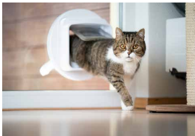
Eine Mikrochip-Katzenklappe schützt vor ungebetenen Gästen und gibt der eigenen Katze exklusiven Zugang.

Ein scheinbar netter Zug kann sich schnell zum Magneten für fremde Tiere entwickeln: «Wenn man draussen Futter anbietet und es nicht sofort wegräumt, lockt man geradezu weitere Katzen oder Wildtiere an», warnt Giewald. Das Ergebnis: noch mehr Konkurrenz, Auseinandersetzungen und Markierungen im eigenen Revier.